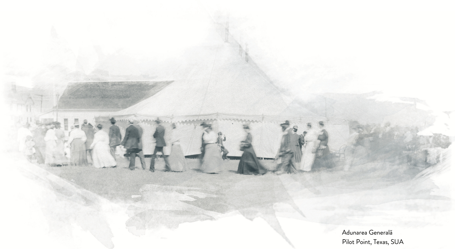
Adunarea Generală Pilot Point, Texas, SUA 13 octombrie 1908

În 1919, cea de-a cincea Adunare Generală a schimbat numele denominațiunii în Biserica Nazarineanului. Cuvântul „penticostal” nu mai însemna același lucru cu „doctrina sfințeniei”, ca în secolul al XIX-lea. Tânăra denominațiune a rămas fidelă misiunii sale originale de a predica vestea bună a mântuirii depline.