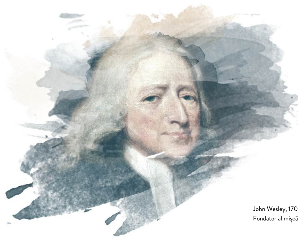
John Wesley, 1703-1791 Fondator al mișcării metodiste

Accentul pus pe sfințirea deplină, este contribuția distinctivă a lui John Wesley la istoria